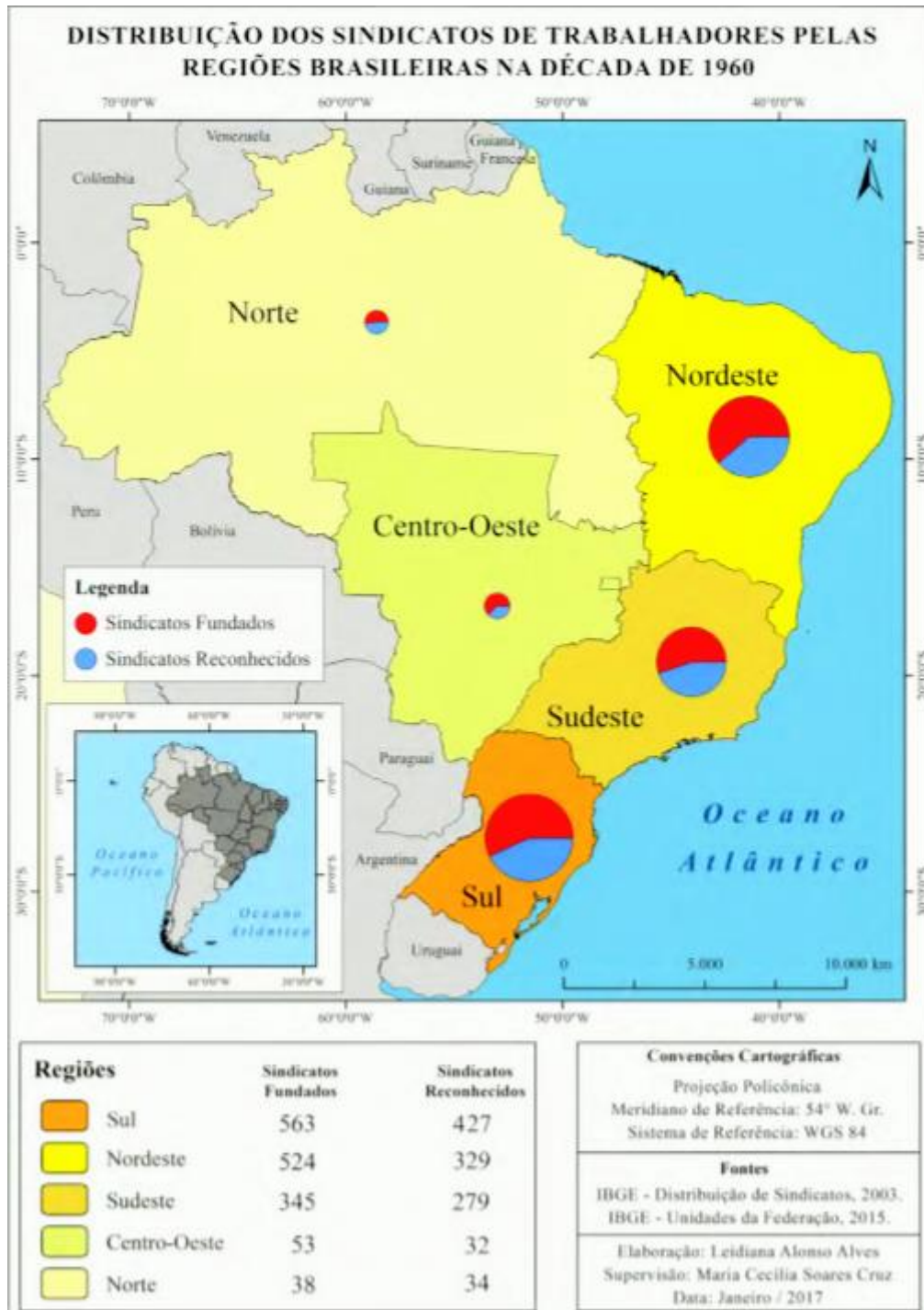
Mapa 2 – Distribuição dos sindicatos de trabalhadores pelas regiões brasileiras na década de 1960