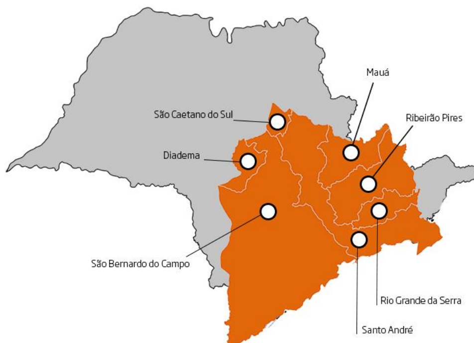
Figura 2 – Região do ABC Paulista