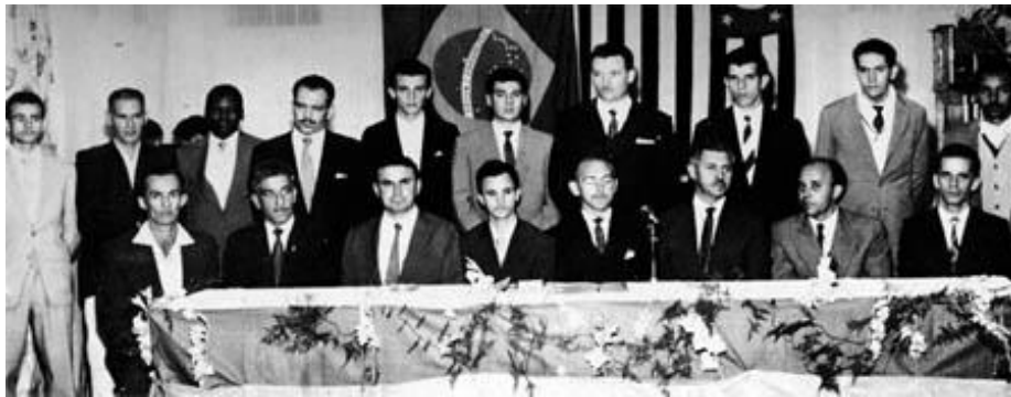
Foto 1 – Primeira diretoria eleita do Sindicato dos Metalúrgicos do ABC (1959)