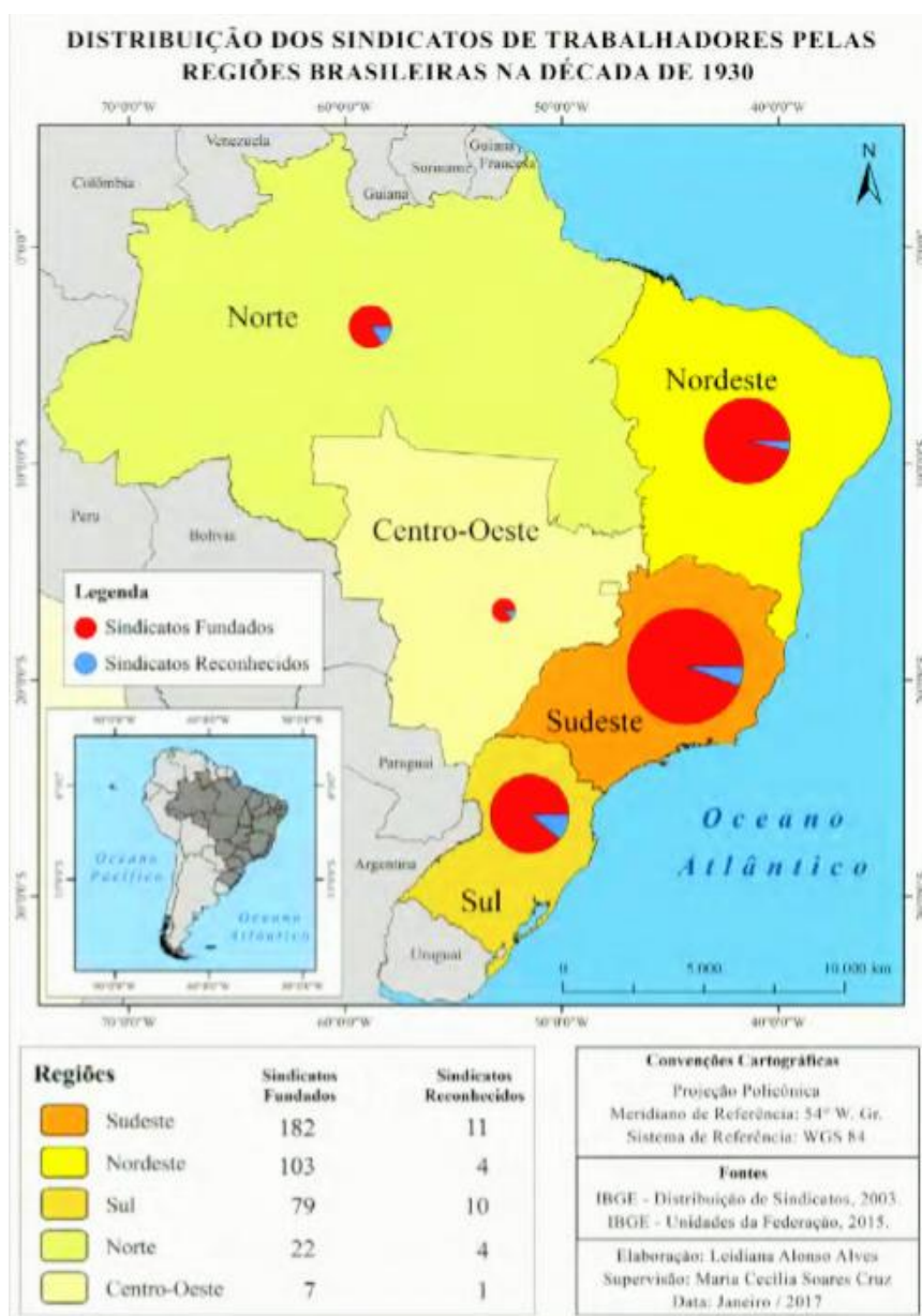
Mapa 1 - Distribuição dos sindicatos de trabalhadores pelas regiões brasileiras na década de 1930