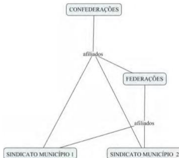
Figura 1 - Estrutura organizacional territorial dos sindicatos na década de 1930

Fonte: CARDOSO, 2002; Organização: Maria Cecília Soares Cruz, 2016.