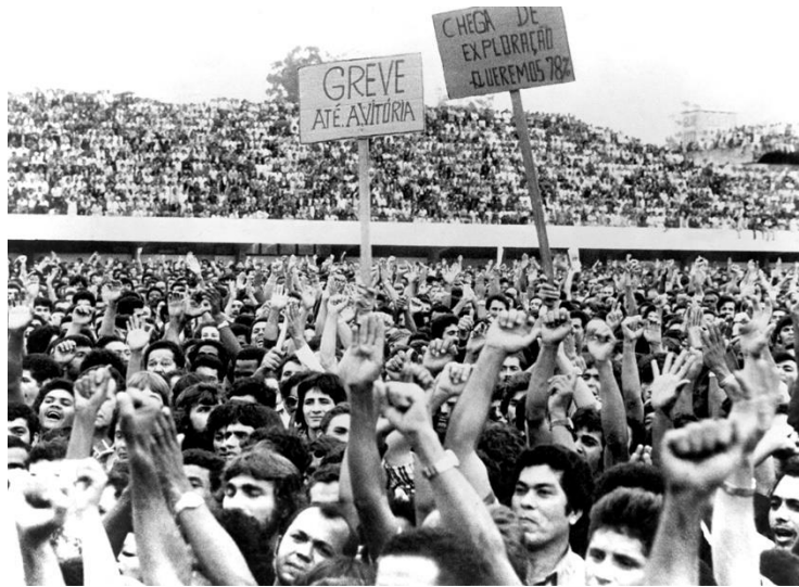
Foto 2- Trabalhadores em assembleia no Estádio de Vila Euclides (São Bernardo do Campo - 1979)