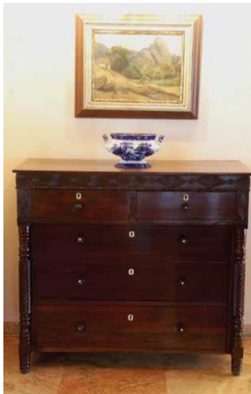
Figura 02: Cômoda com colunas estriadas, século XIX, modelo neoclássico. Acervo do Museu Costa Pinto.

Eram móveis que supriam a necessidade mais básica da casa, e a diferença de utilização entre as classes era definida de acordo com a sua dimensão técnica, produtiva e pelo valor agregado. Móveis com um certo requinte no que tange às técnicas mais rebuscadas no trabalho com a madeira, destinados às pessoas de posses como os senhores de engenho (Figura 02).