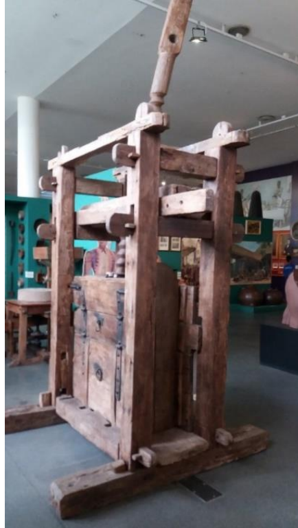
Figura 01: Prensa para fazer farinha de mandioca.