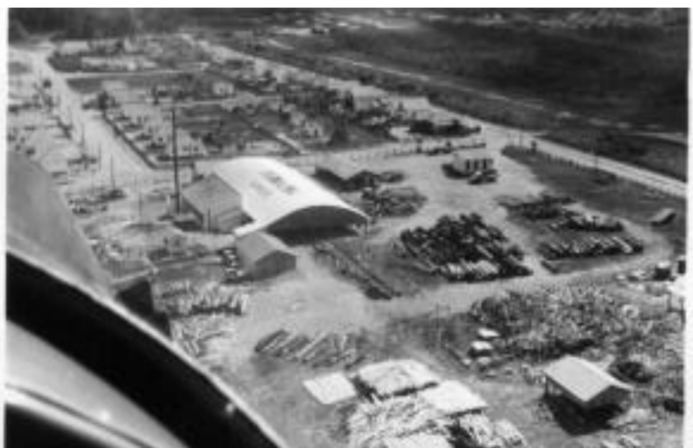
Figura 3: Vista aérea de Ivinhema-MS em 1963

O núcleo urbano central, a cidade de Ivinhema, foi construído na Gleba Piravevê, para receber toda a infraestrutura da administração pública, área para a construção de bairros, indústrias e comércio, para que houvesse também a disponibilização de recursos aos colonos no campo, como assistência técnica e comercial na compra e comercialização de produtos (ANTÔNIO, 2021).