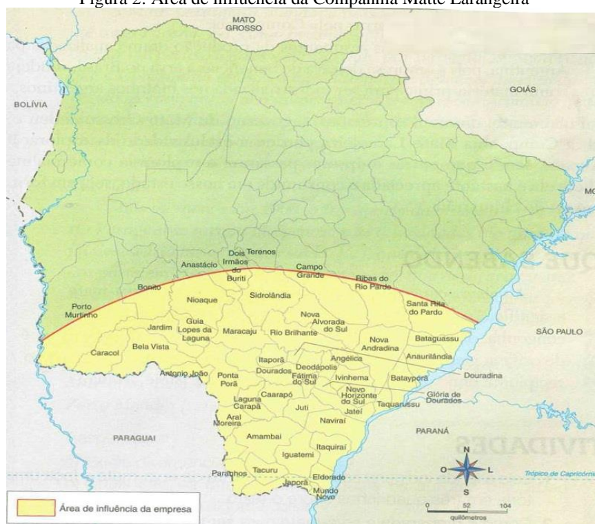
Figura 2: Área de influência da Companhia Matte Larangeira